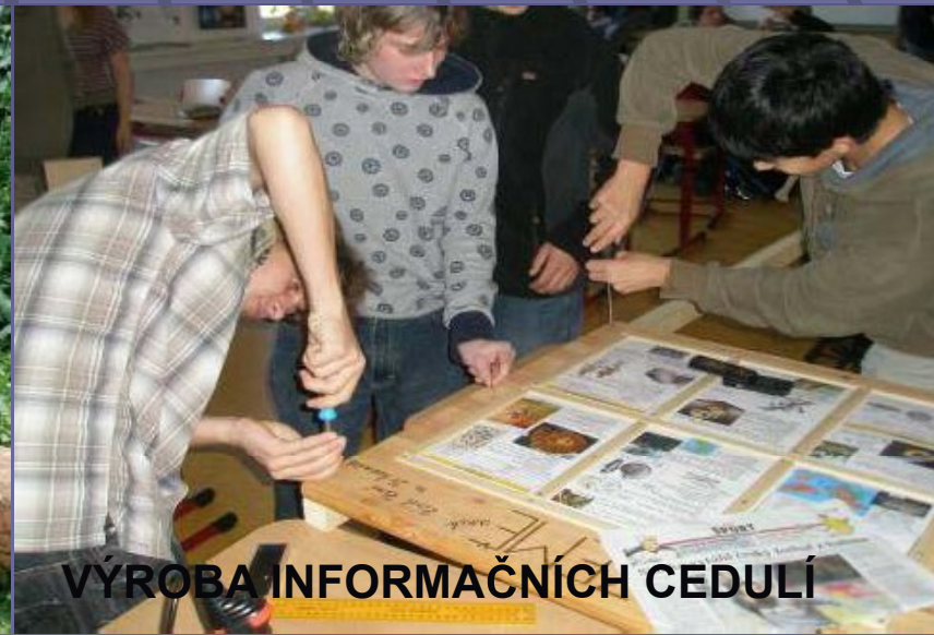
VÝROBA INFORMAČNÍCH CEDULÍ