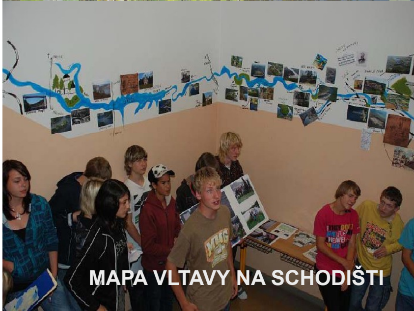
MAPA VLTAVY NA SCHODIŠTI