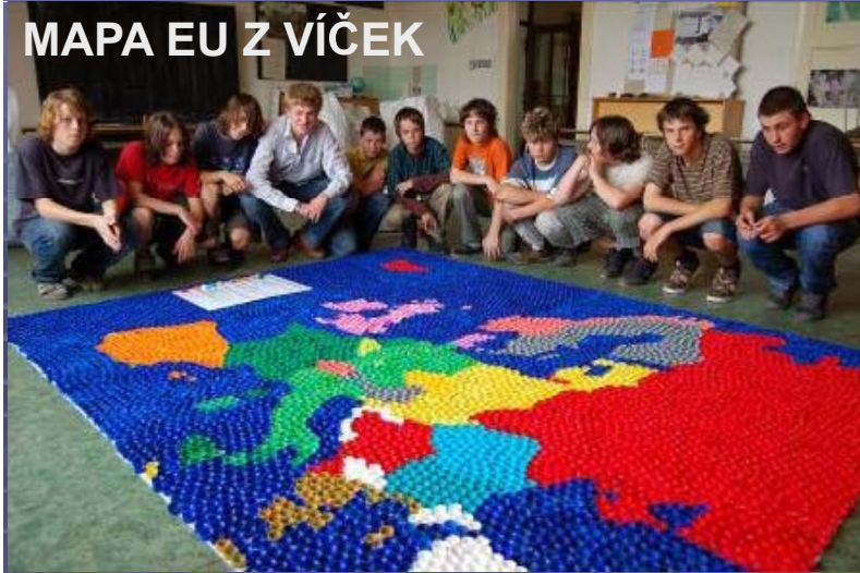
MAPA EU Z VÍČEK