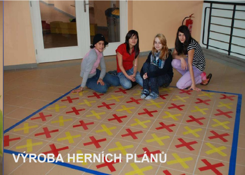
VÝROBA HERNÍCH PLÁNŮ