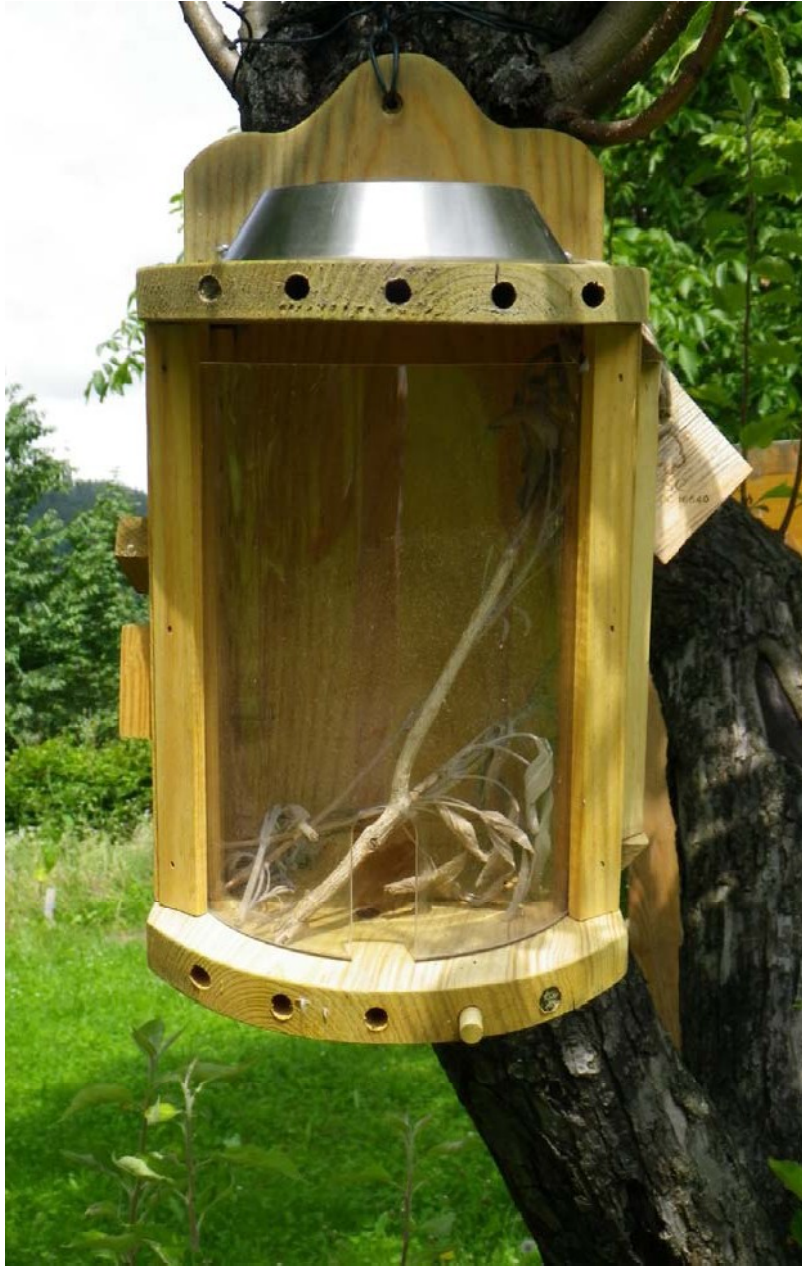
solární divadlo pořízené v rámci školního grantu