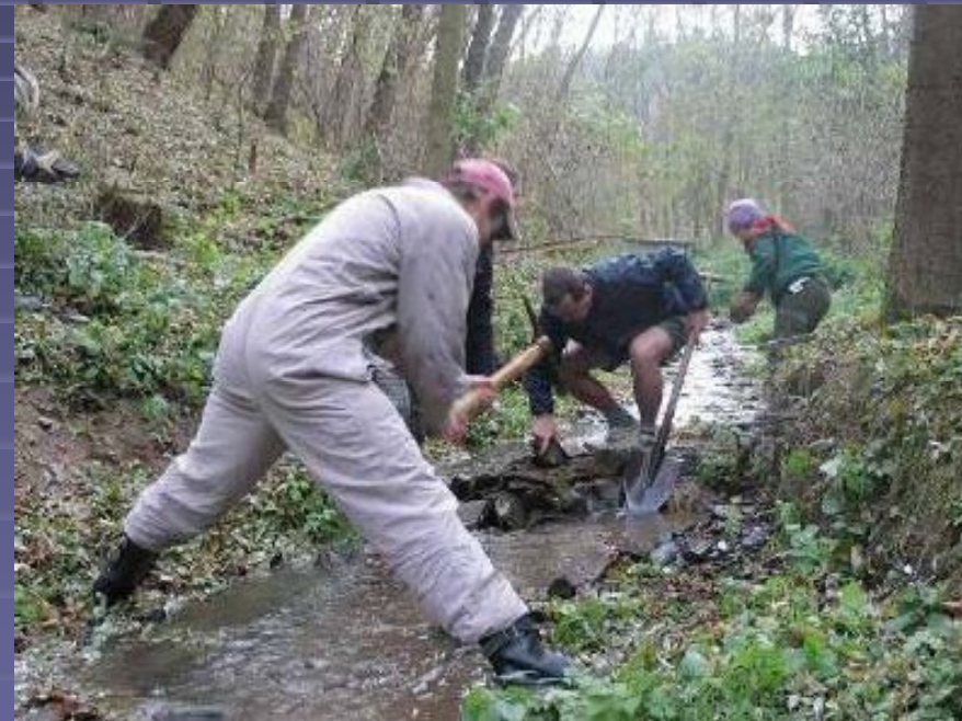
výzkumy potoka financované obecním úřadem