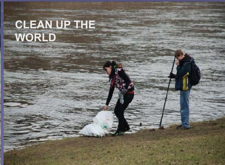
CLEAN UP THE WORLD