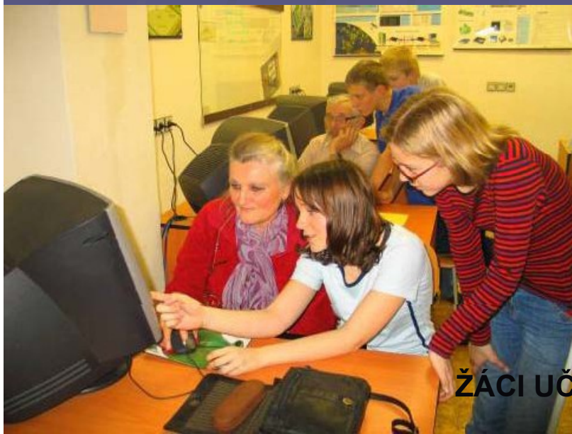
ŹĀCI UĀI SENIORY