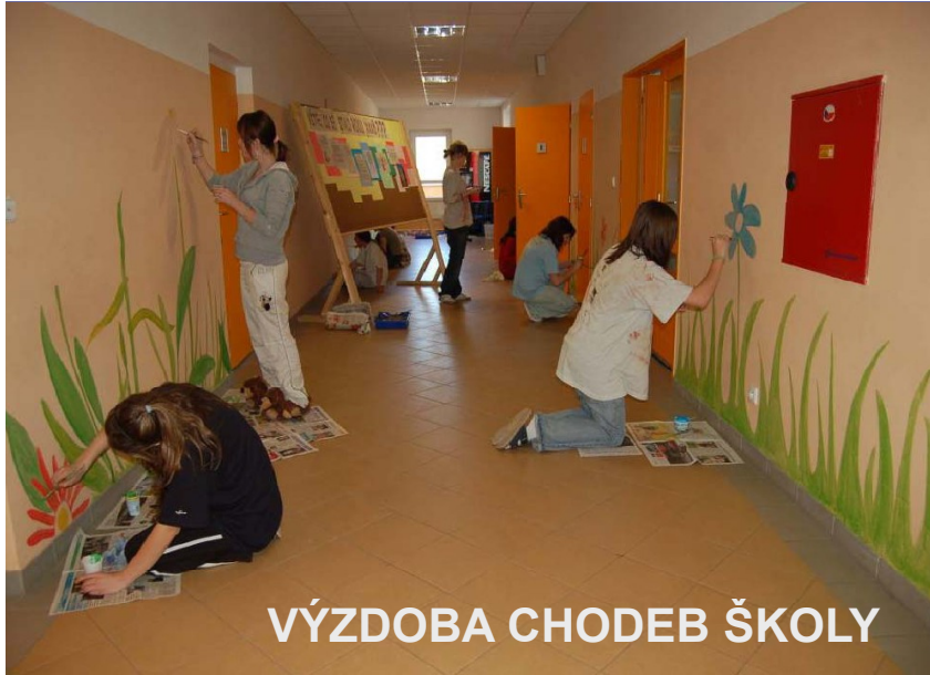
VÝZDOBA CHODEB ŠKOLY