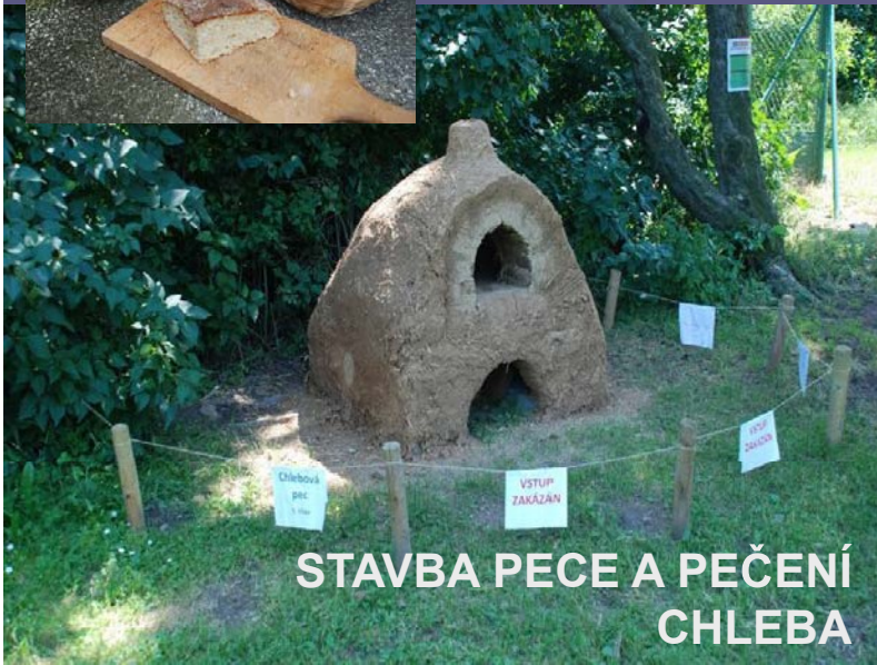
STAVBA PECE A PEČENÍ CHLEBA