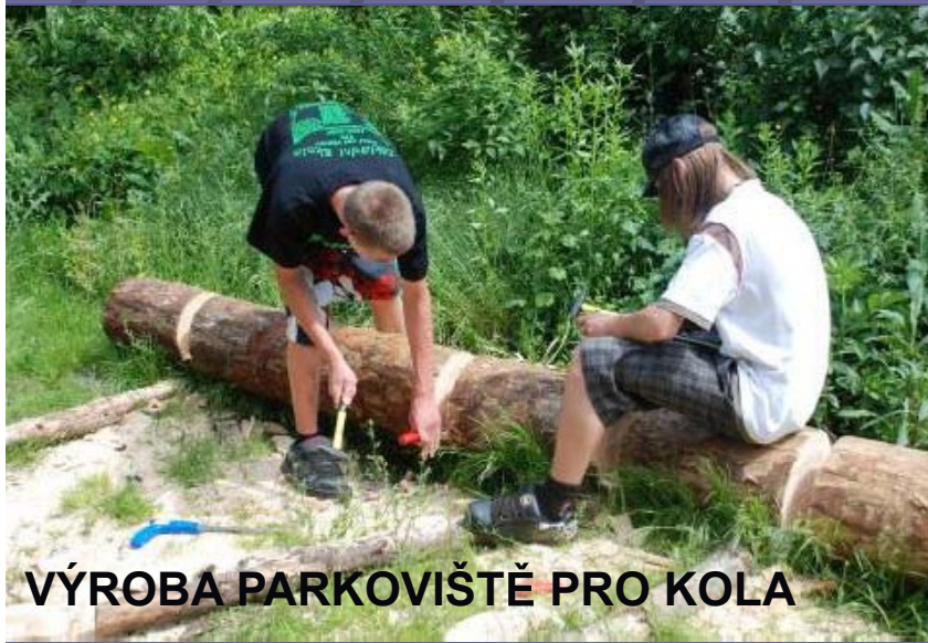
VÝROBA PARKOVIŠTĚ PRO KOLA