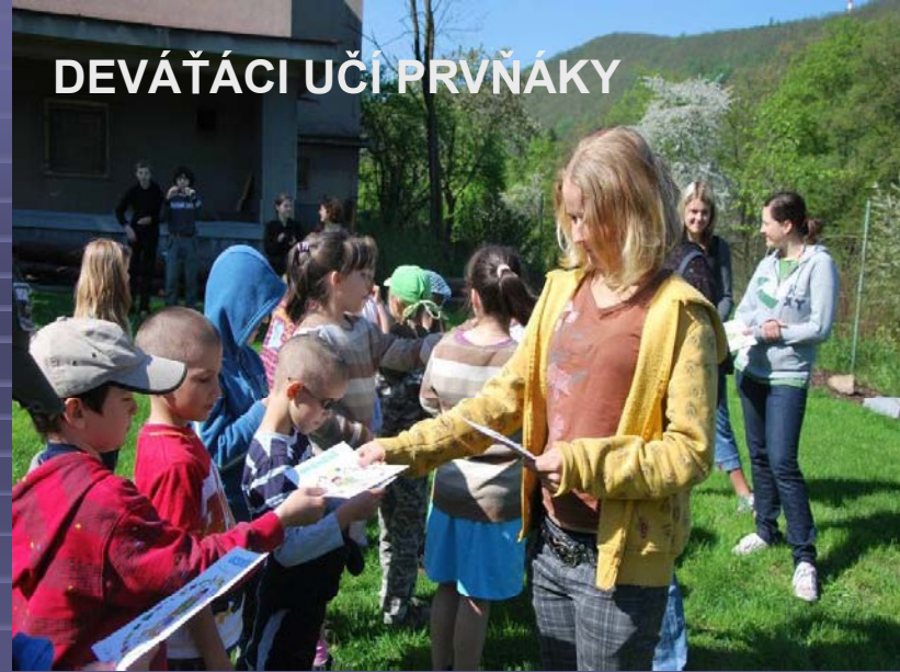
DEVĀĀCI UĀI PRVNĀKY