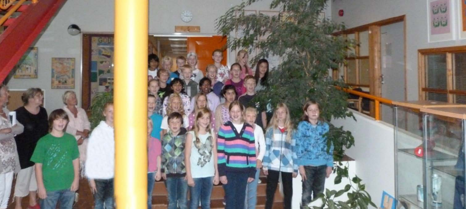
ZŠ Godeset skole