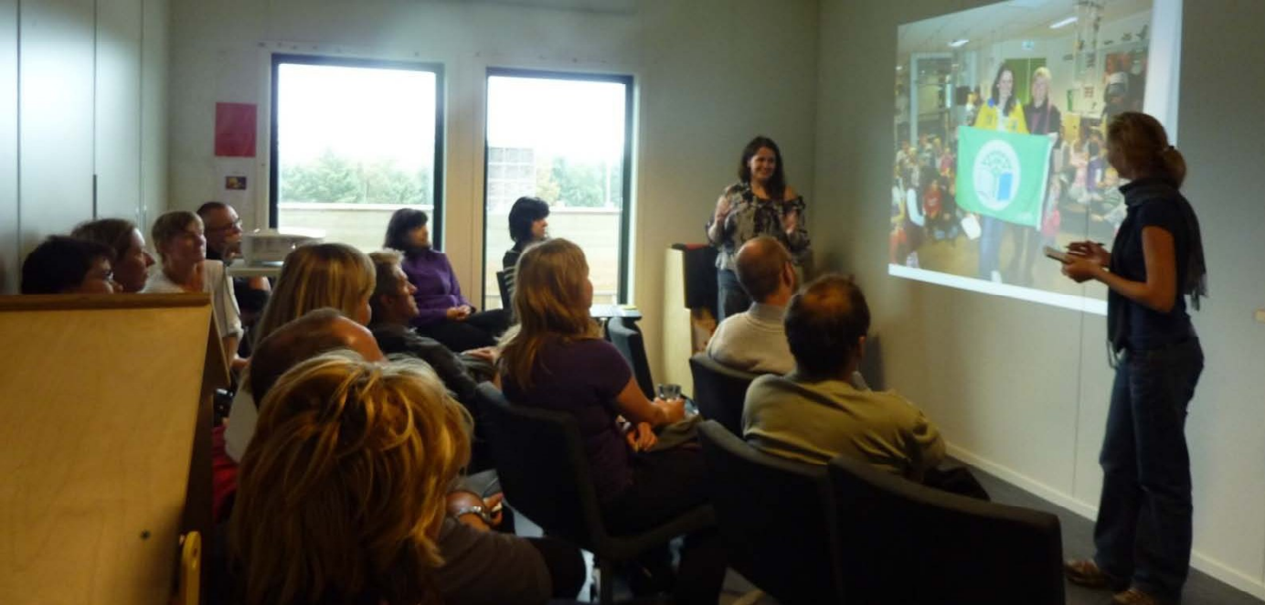
MŠ Lassamyra barnehage